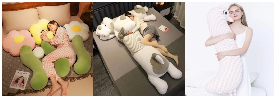
图表 2：睡觉抱枕图示