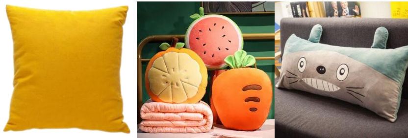
图表 1：不同形状抱枕

按照场景分类，抱枕主要可分为沙发抱枕、汽车抱枕和床上抱枕。本项目的睡觉抱枕属于床上抱枕领域物品。