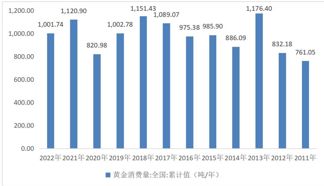
图表 6：2011-2022 年中国黄金消费量统计（吨）