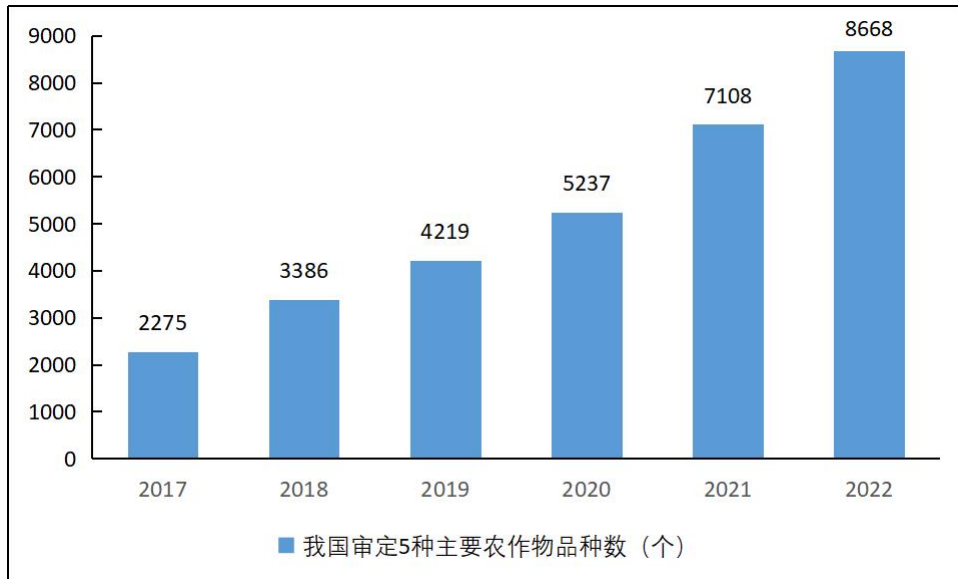
图表 6：2017-2022 年我国审定 5 种主要农作物品种数

了《主要农作物品种审定办法》，拓宽试验渠道、缩短试验年限、实施引种备案等，随之品种数量迅速增加，品种类型丰富多样，但品种原始创新能力不强、审定准入门槛偏低、同质化品种多等新问题也日趋突出。2021年《中华人民共和国种子法》修订，提高了审定门槛，重在引导培育突破性品种，建立实质性派生品种制度，强化种业知识产权保护，品种“井喷”局面将会得到改善。