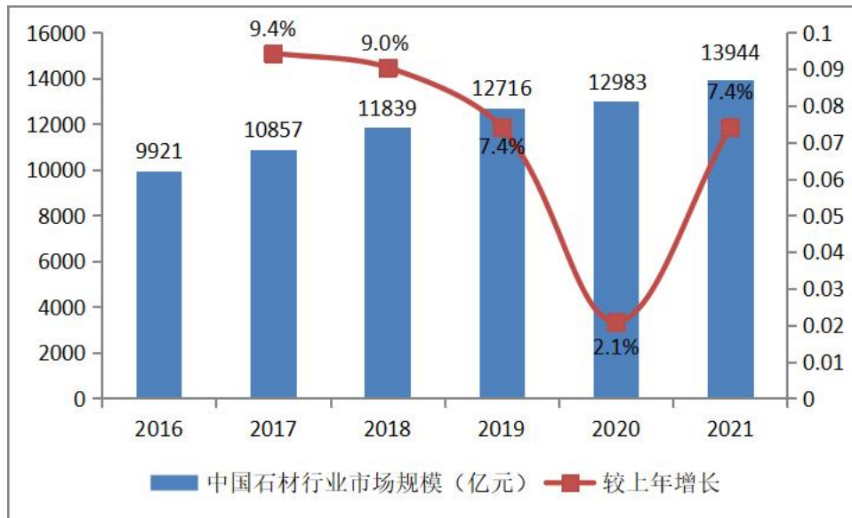
图表 24：2016-2021 年中国石材行业市场规模及其增速