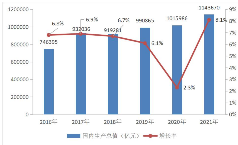
图表 3：2016-2021 年国内生产总值及增长率

尽管外部环境的严峻变化对国内经济造成了一定冲击，但我国的经济发展充满韧性，增长空间依然存在，国内经济长期向好的发展趋势不会因为外部力量的阻碍而改变，为本项目的实施奠定了良好的宏观经济环境。