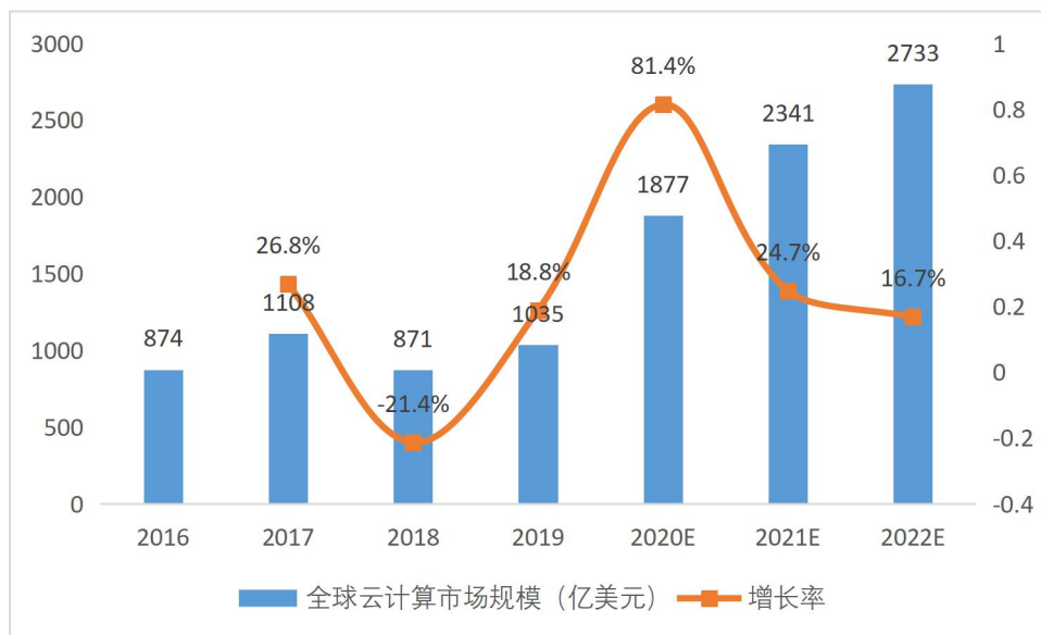
图表 9：全球云计算市场规模及增速

国际云计算市场保持高速增长。据最新统计，全球云计算市场较快增长，2019年云计算市场规模达到1653亿美元，同比增长21.3%；预计2022年市场规模达到2733亿美元。其中，SaaS服务的增长是推动云计算市场增长的重要原因之一，2019年全球SaaS服务市场规模将达到1035亿美元，同比增长18.8%，预计2022年市场规模将达到1578亿美元。