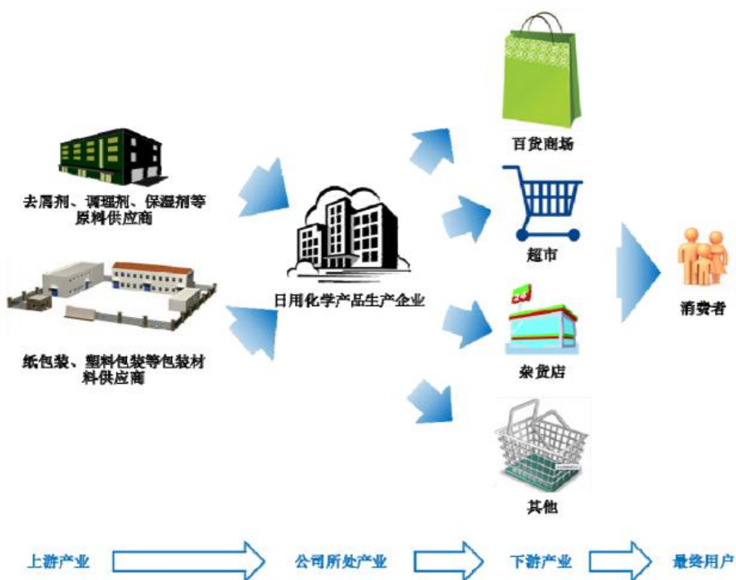
图表 8：日化行业产业链示意图