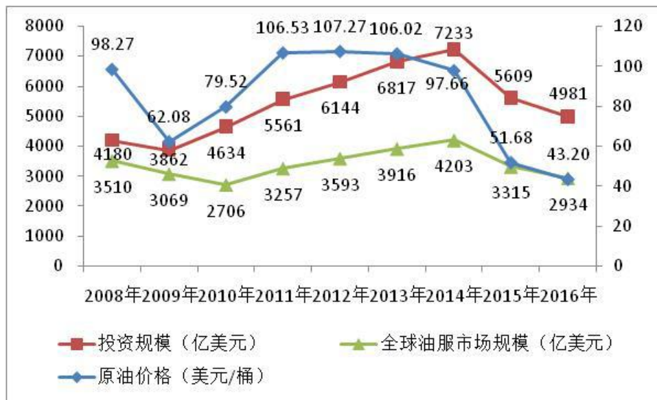
图 3-15 2008-2016 年全球油田技术服务市场规模

石油技术服务行业整体市场直接受下游石油开发公司石油投资计划影响，具有极强正相关性，同时石油开发公司石油投资计划的最大风向标就是国际油价，因此可以说全球油价的变化趋势，在极大程度上影响了石油技术服务市场的发展。全球原油价格、石油勘探开发投资和油田技术服务市场的关联情况可以根据下图清晰看出。