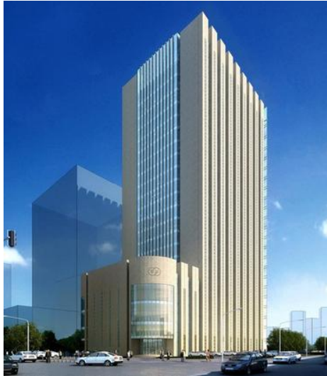
广东某成立外资融资租赁公司